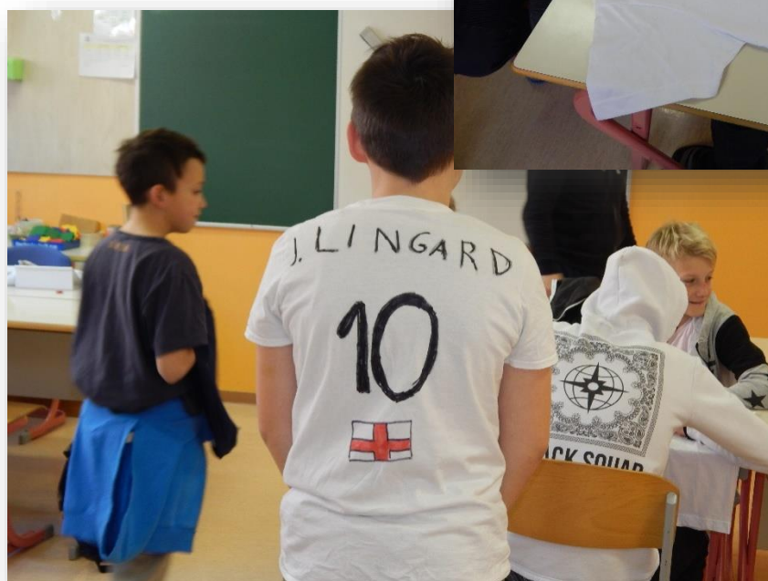
Eva in Lana, 8. a