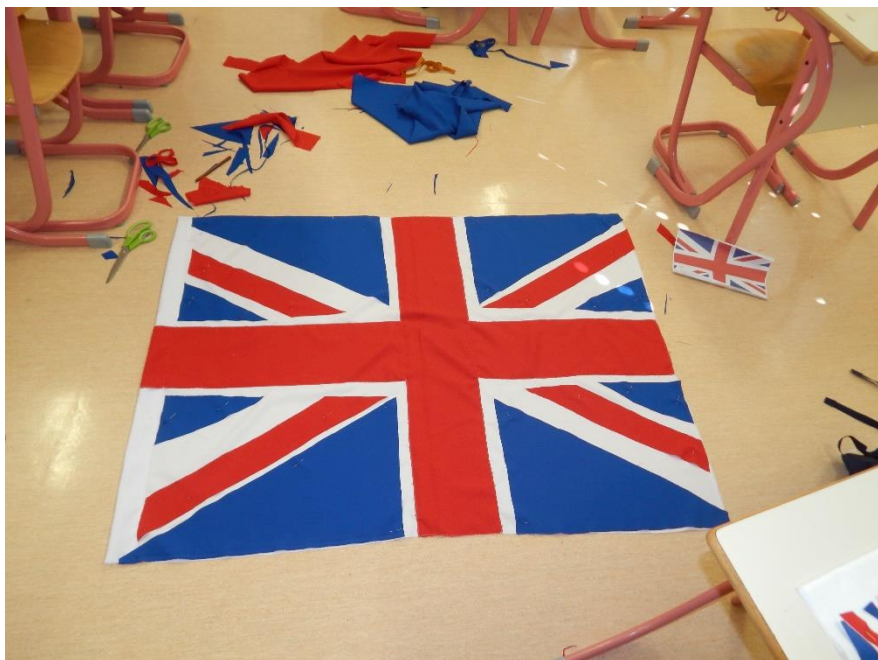
Urban in Erik, 7. a

ZARJA, 7. a: "Zelo smo zadovoljni z delavnico."