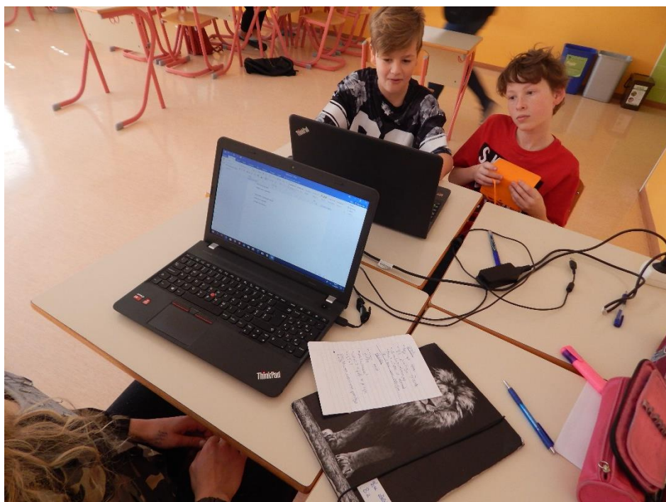
Lana in Eva, 8. a